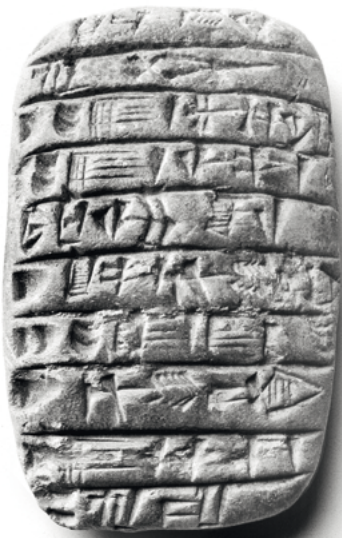
Dieser Stein aus der irakischen Frühzeit enthält Texte in Zeichenschrift. Mit der stark seitlichen Beleuchtung versuchte ich, die Konturen der Zeichen hervorzuheben und die Steinstruktur zu zeigen.